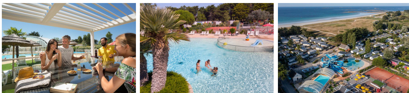
Illustrations du Camping La Plage élu « Camping Préféré des Français 2025 »

Pour découvrir le « Camping Préféré des Français 2025 » : La Plage - Penmarch